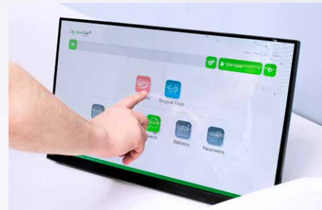
ergonomische Bedienung über HD-Touchscreen