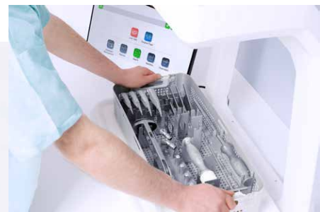
neue, große Plattform auch für Trays